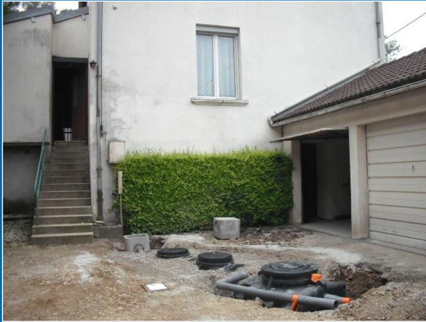
Travaux en cours