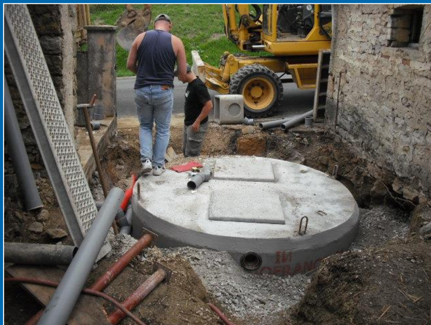
Travaux en cours