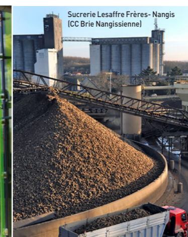
Sucrierie Lesaffre Frères - Nangis (CC Brie Nangissienne)