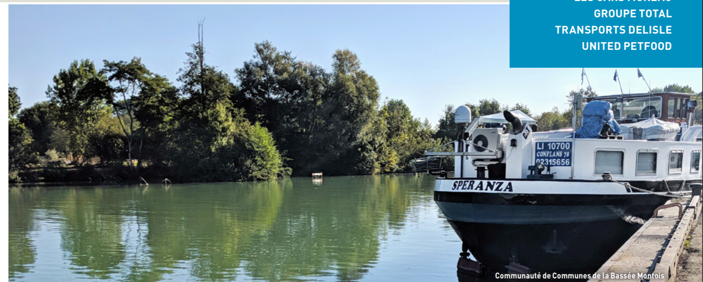
Communauté de Communes de la Basseée Montois

Soucieuses de proposer une offre immobilière complète, les collectivités se sont positionnées sur l'ouverture de plusieurs télécentres qui permettront aux salariés qui le souhaitent de gagner du temps de transport en travaillant plus près de chez eux.