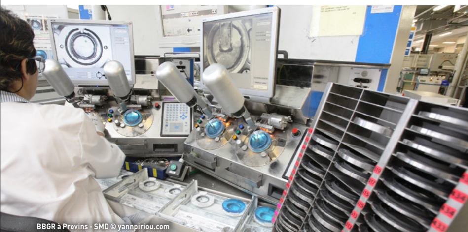
BBGR à Provins - SMD